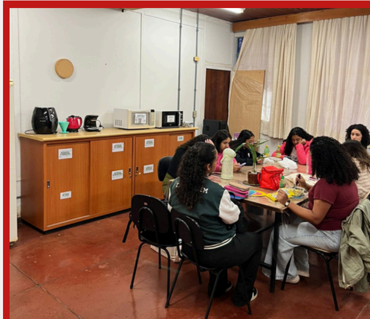
Nova sala do CAENF

Seguindo há três anos na luta por espaços físicos para centros acadêmicos e entidades estudantis, após o mapeamento de salas abandonadas no primeiro ano de gestão, conseguimos em 2025 ampliar ainda mais o acesso a espaços físicos, dando direcionamentos, apoio e auxílio para ocupação e revitalização de espaços antes não utilizados para os Centros Acadêmicos de Enfermagem (CAENF), Farmácia (CAFES), Biomedicina (CABM), Biotecnologia (CABTEC), Bioquímica (CABIQ) e Artes Cênicas (CALIS) além da Atlética Biológicas e sua bateria, Biotucada , assegurando, apenas nesse ano de gestão, que o espaço universitário seja ocupado devidamente por 8 novas entidades e zerando os CAs ativos sem sala no campus sede!